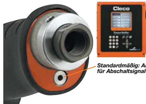
Standardmäßig: Anschluss für Abschalt-signal-Kit.